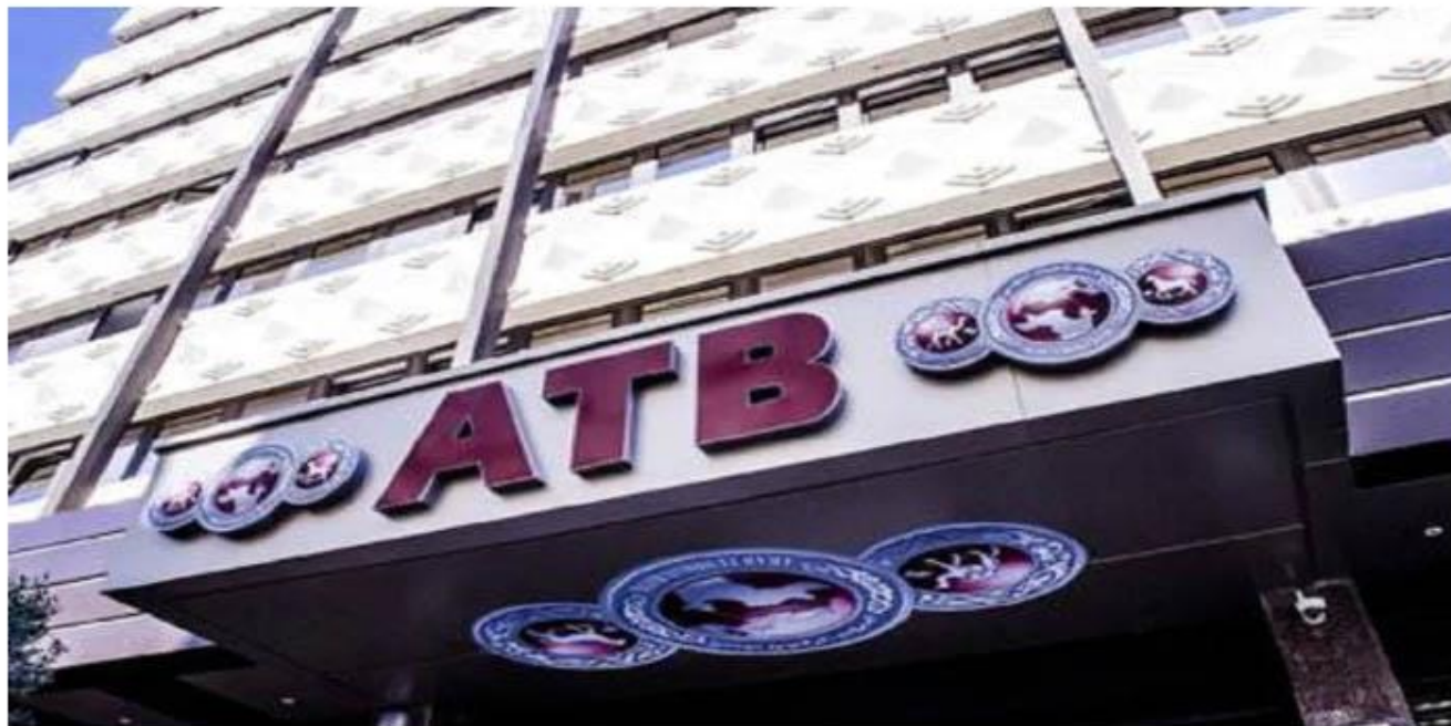
Siège de l'ATB à Tunis Ftich Rating

Par L'Économiste Maghrébin - 29 mars 2022